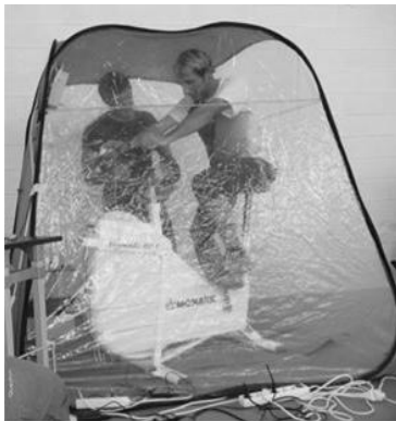
SECRECIÓN DE ERITROPOYETINA ENDOGENA TRAS 90 MINUTOS DE HIPOXIA SIMULADA A 5000 metros

Azaroak 23 eta 24 (23 y 24 de Noviembre)