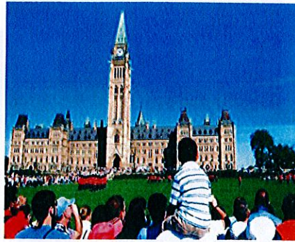
El Parlamento de Canadá en Ottawa

El encaje de las diferencias ha sido siempre y sigue siendo un sello de la sociedad canadiense. Por su desarrollo histórico, social y cultural, Canadá ha sido y es un país de compromiso que se caracteriza por su espíritu moderado y tolerante.