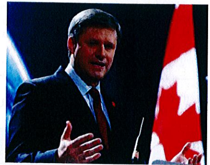
El primer ministro Stephen Harper

Partido Conservador: 165 Nuevo Partido Democrático: 101 Partido Liberal: 35 Bloque Quebequés: 4 Partido Verde: 1 Independientes: 2